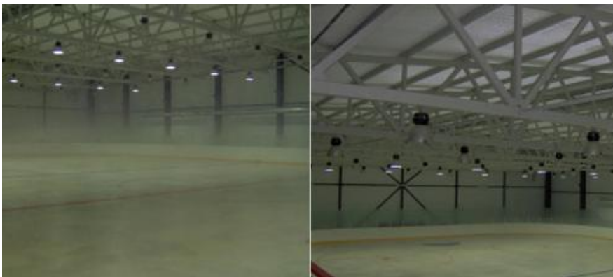
Ishall före och efter installation av avfuktare.